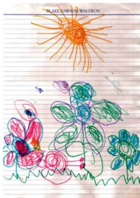
Rajzolta: Hevesi Nagy Emese

IV. Béla lemondott birtokállománya helyreállításáról. 1270. május 3-án halt meg. Halála után az esztergomi ferencesek templomába temetkezett családjával. Bélát fia követte a trónon, aki V. István néven uralkodott.